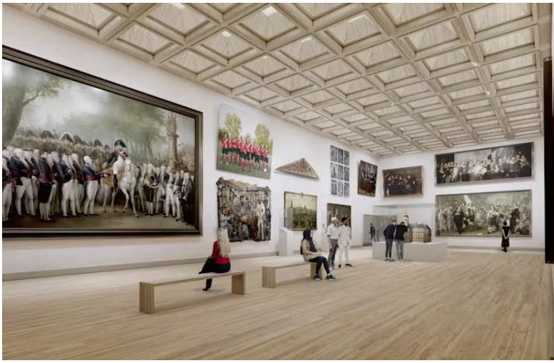
Render Grote Zaal.