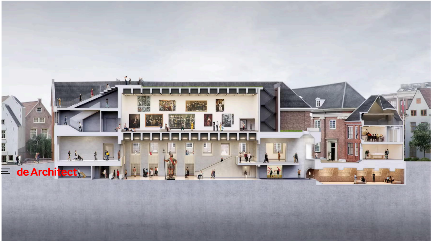
Render Stadshal met Grote Zaal en het gewelf. Beeld Absent Matter