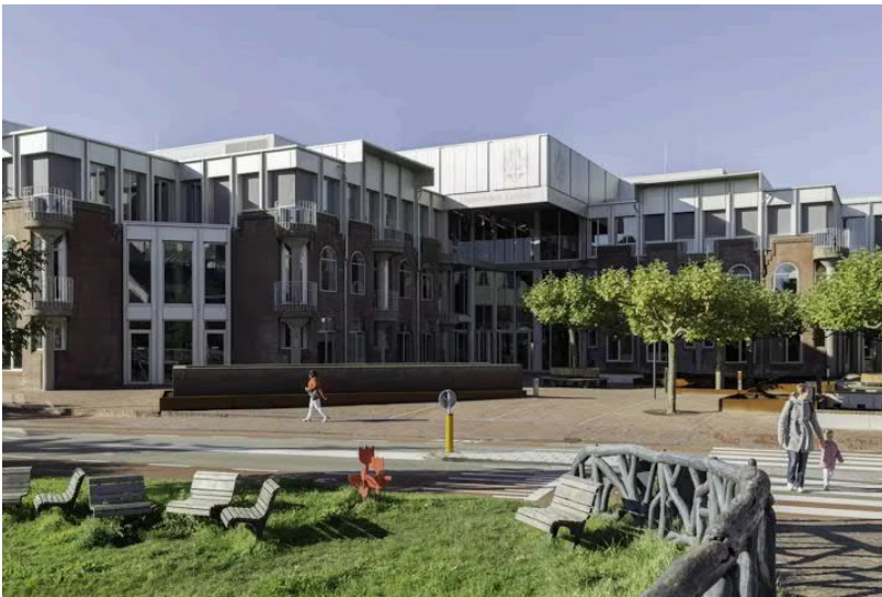
Beeld De Zwarte Hond

Bij de ontwikkeling van dit gebouw is 72 procent meer gerealiseerd aan duurzame maatregelen dan het bouwbesluit voorschrijft. Door voor het hele gebouw hoogwaardige materialen met een lage uitstoot van ongezonde stoffen te selecteren, beschikt Herta Mohr nu over een BREEAM Excellent-certificering. Verder zijn isolatie, zonnepanelen en een warmte-koudeopslagsysteem toegevoegd.