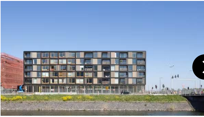
Beeld Stijn Poelstra